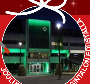
JOULUN AVAUS KAUPUNGIN TALON EDUSTALLILLA