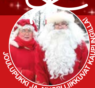
JOULUPUKKI JA -MUORI LIIKKUVAT KAUPUNGIN TALLILLA