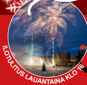
ILTOTULITUS LAUANTAINA KLO 16