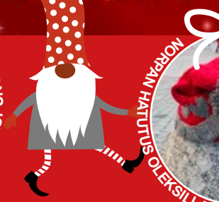
JOULUPUKKI HÄTÄTYS OLEKSILLA